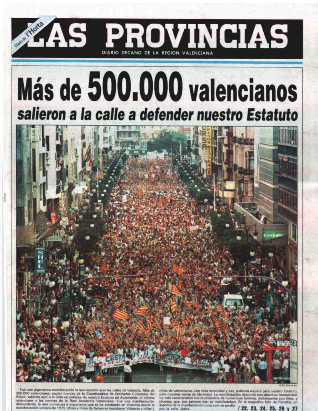
Image 1: Portada del diari Las Provincias del 14 de juny de 1997, en el titular “Más de 500.000 valencianos salieron a la calle a defender nuestro Estatuto”.