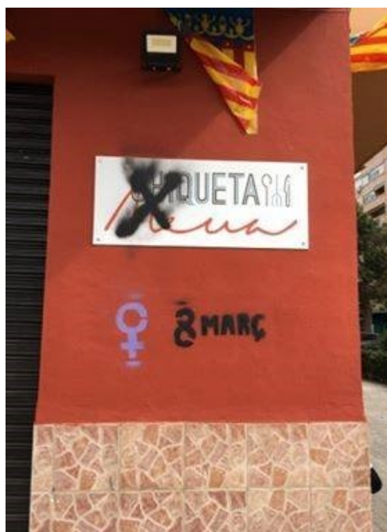
Image 3. Pintades en la rotulació d'un restaurant